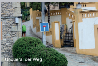
Unquera, der Weg