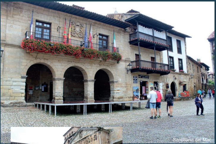
Santillana del Mar