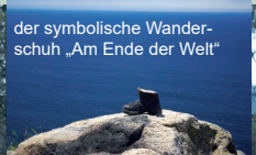
der symbolische Wanderschuh „Am Ende der Welt“