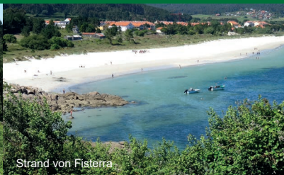
Strand von Fisterra

Noch im Mittelalter glaubte man, am nordwestlichsten Zipfel Spaniens, in Fisterra, das Ende der Welt erreicht zu haben. Pilger des Jakobswegs wanderten auch das letzte Teilstück von Santiago und ließen dann Ihre Wanderschuhe an diesem Ort. Von dem Leuchtturm schweift der Blick über das unendlich weite Meer und die von den Naturgewalten zerklüftete Küste. Costa del Morte, die Todesküste nennt man diese Region. Eine ausgesprochen rauhe, grandiose Landschaft erwartet den Besucher. Bei dem berühmten Leuchtturm gibt es eine kleine, zünftige Unterkunft mit Restaurant. Nicht verpassen sollte man eine Tour entlang der Küste, und bunte Mischwälder, gesäumt von Ginster und Wildblumen.