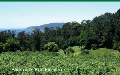
Blick auf's Kap Finisterre