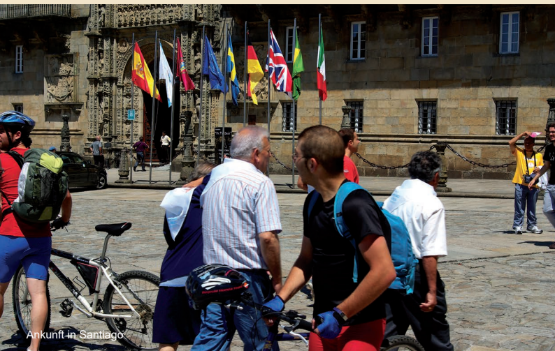
Ankunft in Santiago