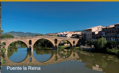
Puente la Reina

Eine gute Alternative ist es, den Jakobsweg per Fahrrad zu erfahren. Für die Compostela brauchen Sie zwar nur 200 km, wir empfehlen Ihnen aber die Strecke von Pamplona bis nach Santiago zu bereisen. Sie erleben die verschiedensten Landschaften und lernen die interessantesten Städte Nordspaniens bei dieser Tour kennen. Insgesamt ca. 730km für die wir 13 Tagesetappen eingeplant haben. Kürzere Abschnitte auf Anfrage.