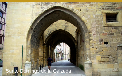
Santo Domingo de la Calzada