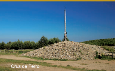
Cruz de Ferro