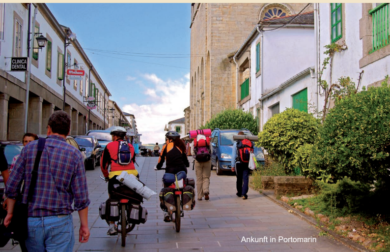
Ankunft in Portomarin