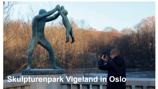
Skulpturenpark Vigeland in Oslo