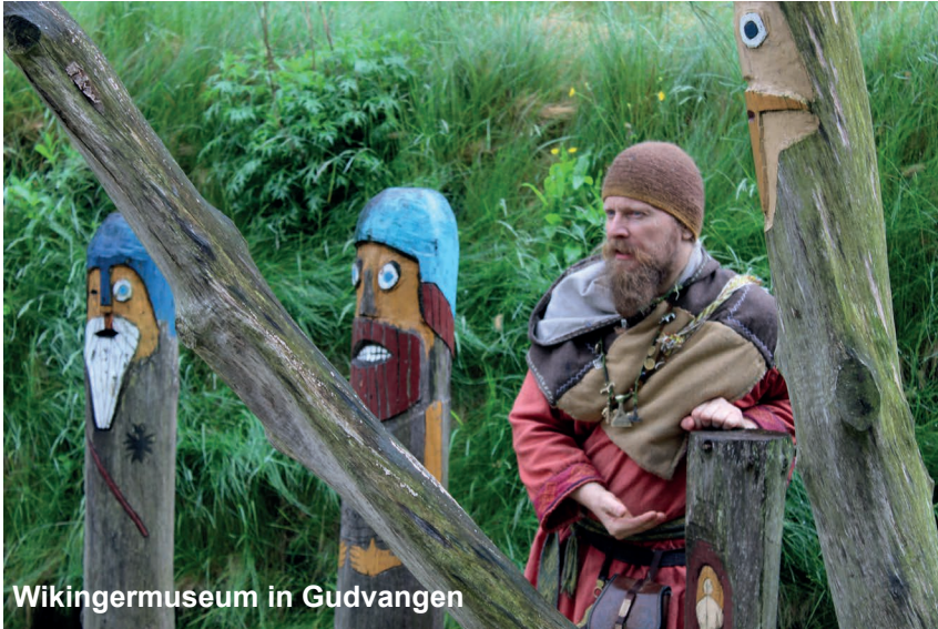
Wikingermuseum in Gudvangen