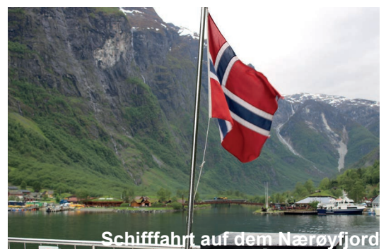
Schiffahrt auf dem Nærøyfjord