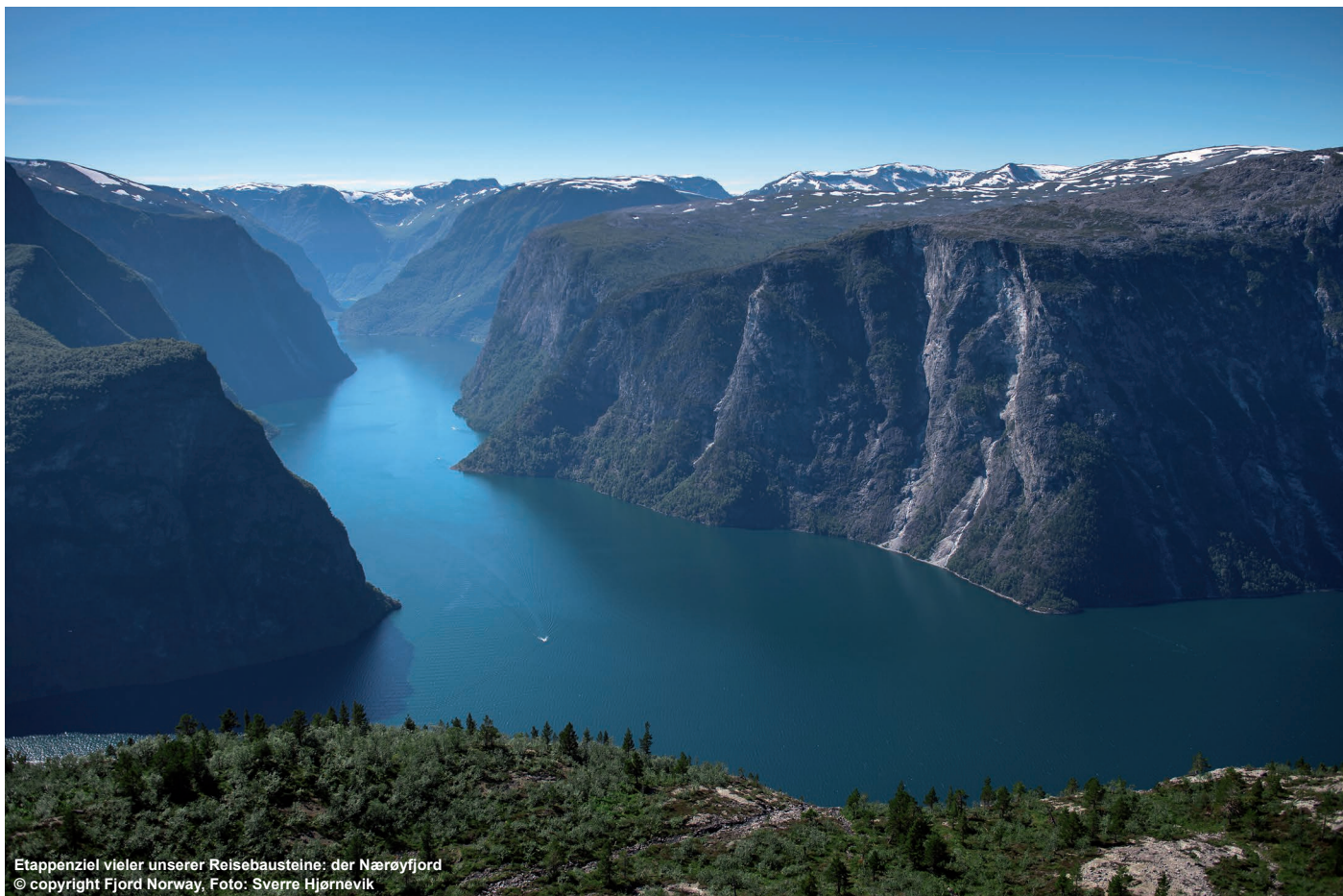
Etappenziel vieler unserer Reisebausteine: der Nærøfjord