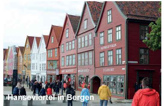
Hanseviertel in Bergen