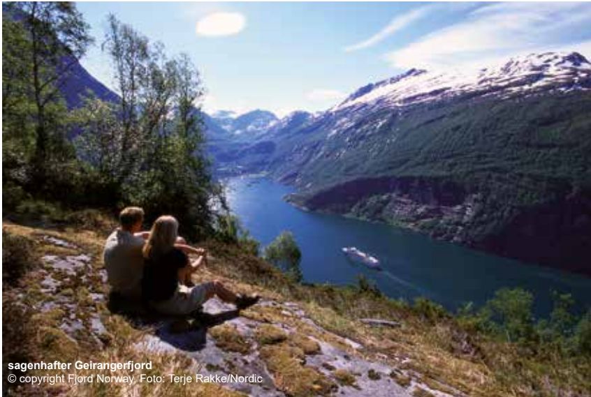
sagenhafter Geirangerfjord