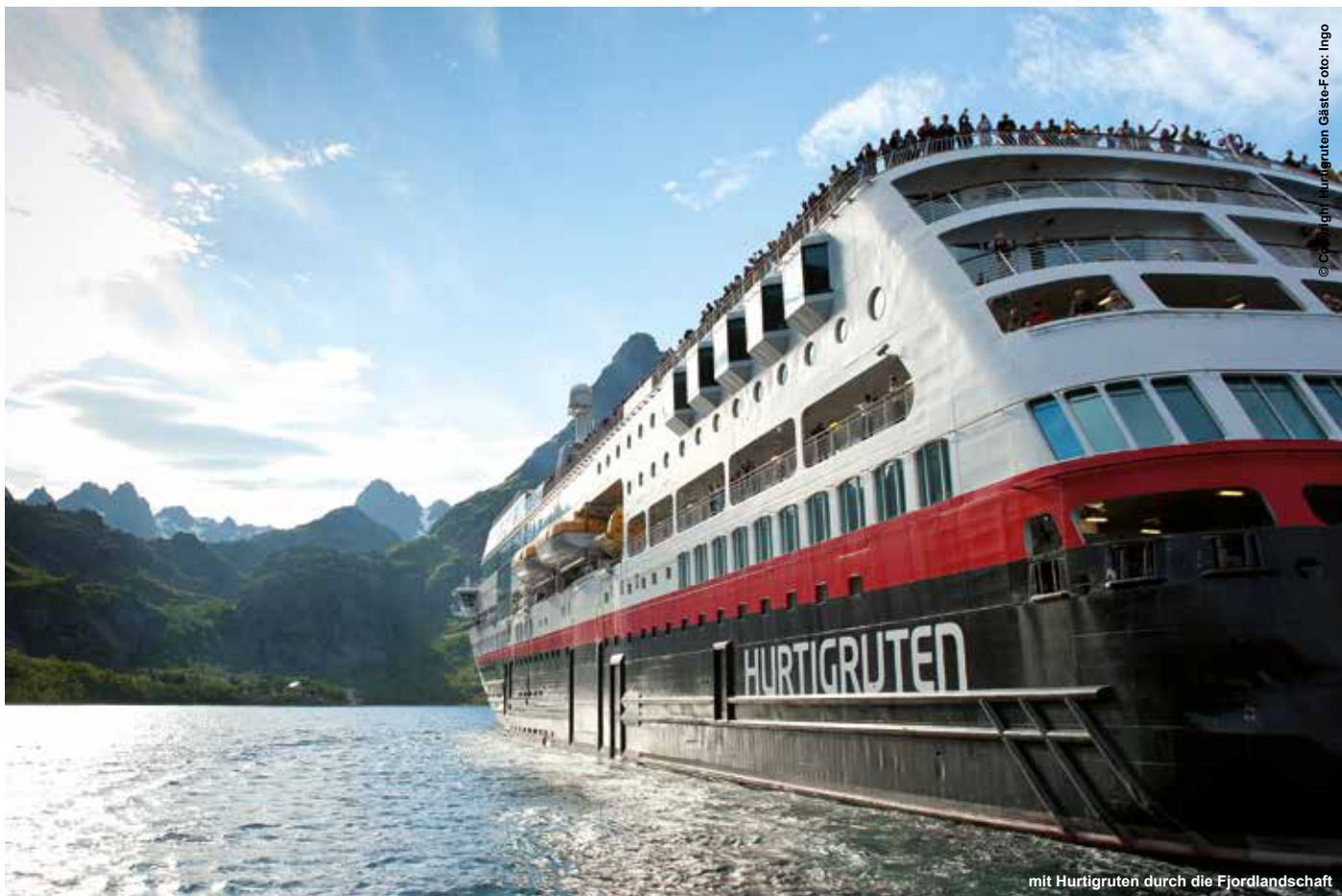
mit Hurtigruten durch die Fjordlandschaft