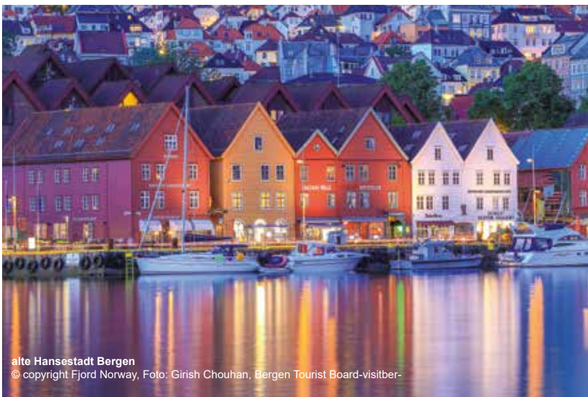
alte Hansestadt Bergen