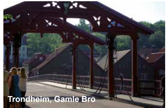
Trondheim, Gamle Bro