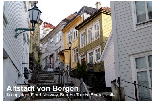
Altstadt von Bergen