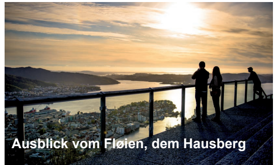
Ausblick vom Fløien, dem Hausberg