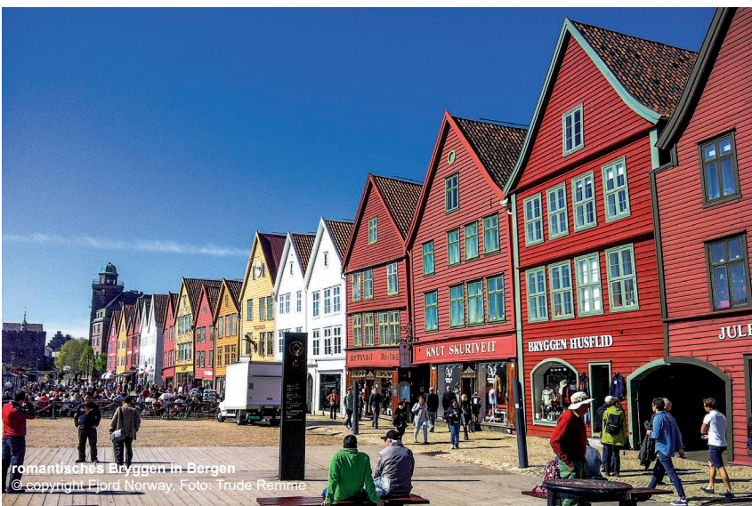
romantisches Bryggen in Bergen