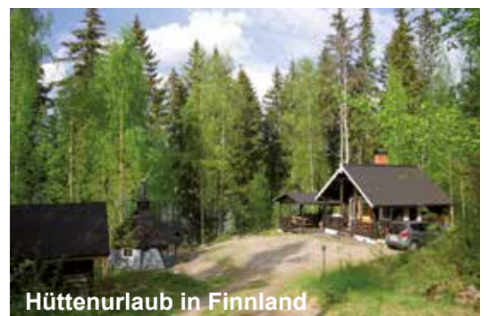
Hüttenurlaub in Finnland