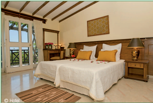
Maisonette, Schlafbereich (Beispiel)