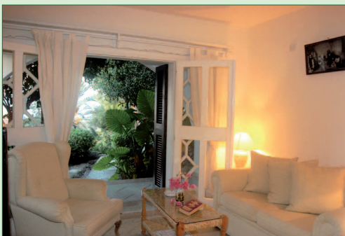
Maisonette, Wohnbereich (Beispiel)